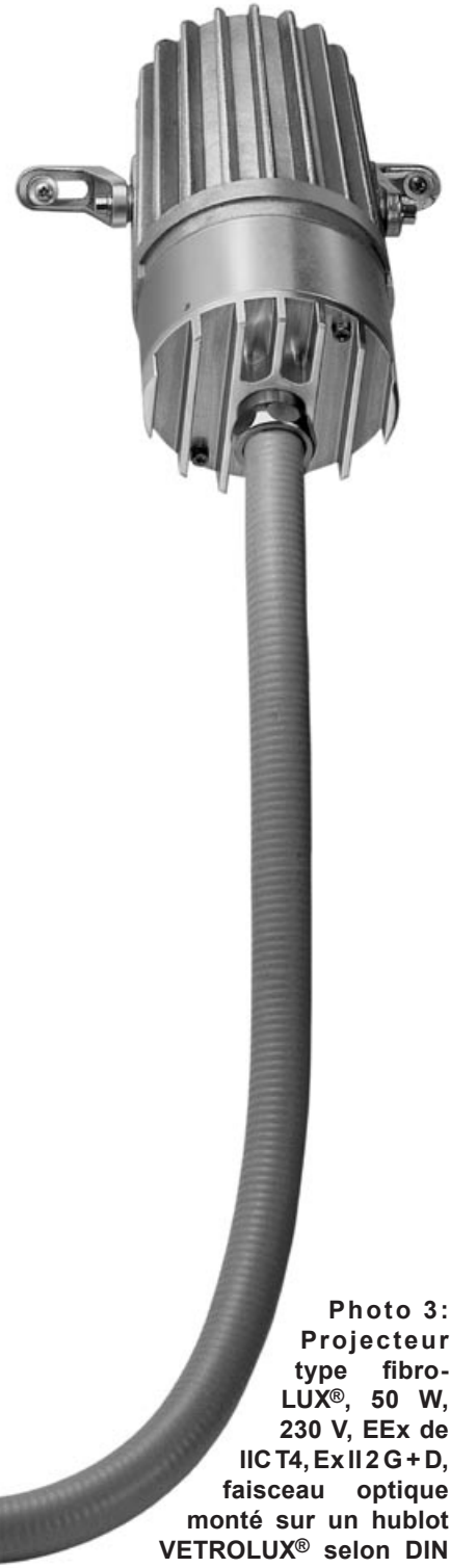
Photo 3: Projecteur type fibro-LUX®, 50 W, 230 V, EEx de IIC T4, Ex II 2 G + D, faisceau optique monté sur un hublot VETROLUX® selon DIN 28120, DN 25

Par rapport à un faisceau lumineux fixe sortant d'un projecteur «classique», la fibre optique permet grâce à sa flexibilité